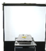
■ プロジェクター (スクリーン付き)