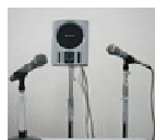
■ スピーカー&ワイヤレス マイク+有線マイク