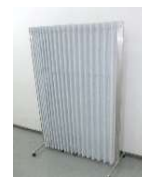
■ 移動式 簡易 パーティション