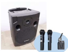
■ 高性能スピーカー &マイクセット