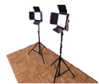
■ LED照明スタンド セット (2個組)