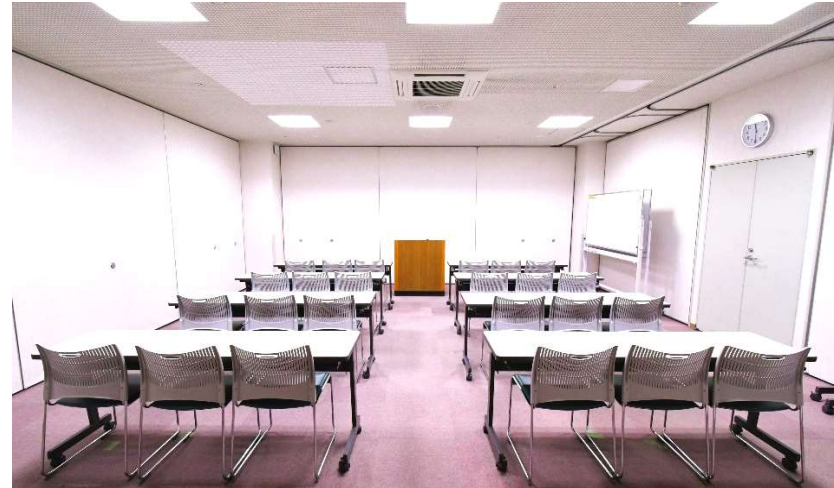
■ 第4会議室 定員 24名(予備机2、予備イス6、司会卓1、ホワイトボード2)