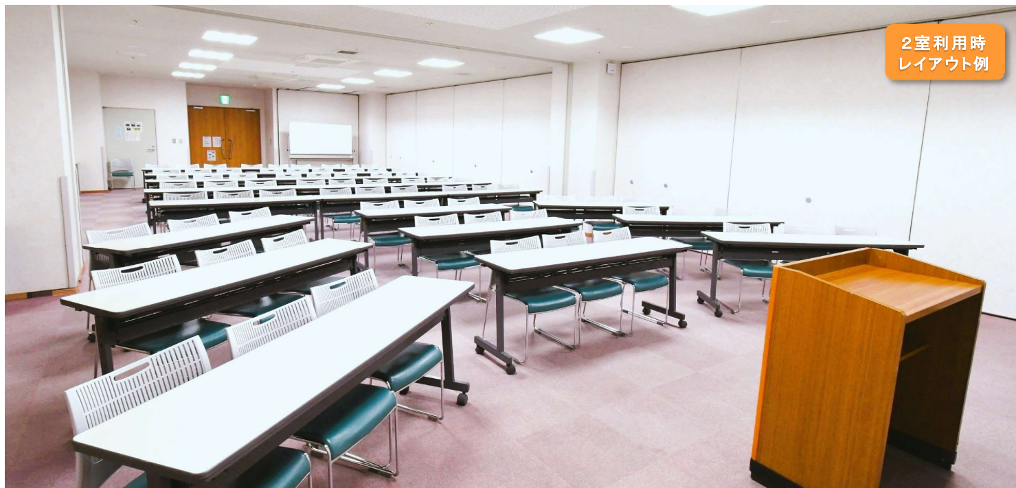
■ 第1会議室+第4会議室 定員 60名(最大72名)