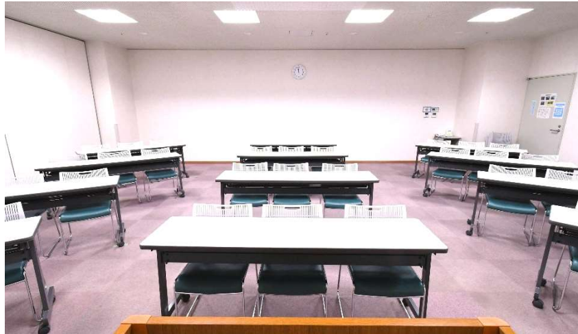
■ 第1会議室 定員 36名(予備机2、予備イス6、司会卓1、ホワイトボード2)